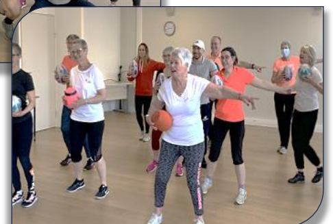
des ateliers ludiques et dynamiques