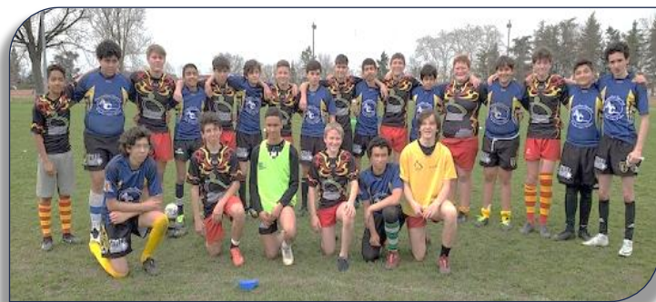
Les deux formations de collégiens à la fin de la rencontre

la rencontre finale pour la qualification au championnat de France UNSS Rugby à XIII a opposé la formation du Collège Champagnat de Feurs qui recevait les jeunes du collège Aimé Césaire de Vaulx en Velin au stade municipal de Feurs. Après une formation rapide aux règles du rugby à XIII des 2 capitaines et des 2 jeunes arbitres académiques sous la tutelle de Quentin et Sébastien animateurs du Comité du Rhône, la rencontre de rugby à 7 contre 7 pouvait débuter en quatre mi-temps de 10 minutes. La pause était atteinte sur un score de 11 à 4 pour les locaux. A la reprise, les vaudais transcendés jettent toutes leurs forces dans la bataille et contre toute attente la formation visiteuse accélère le jeu autour du tenu Ce quart temps est remporté par les visiteurs 6 à 3. Mais les locaux se montrent