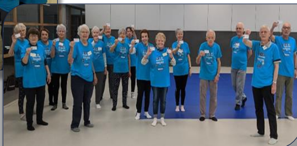
Le groupe de seniors de Caluire RL

Depuis début Mars et la fin des vacances scolaires, plusieurs groupes ont redémarré un deuxième cycle de dix séances comme à Lyon-Bellecour, Gerland et à Lyon-La Guillotière à Villeurbanne Tonkin et à Fontaine St Martin mais aussi à Vourles et à Genas. A Givors le groupe de seniors a terminé le cycle fin Mars et débutera un deuxième cycle au retour des grandes vacances (Octobre). A Caluire un troisième cycle de séances a démarré mi-Mars. A noter qu'un rassemblement de séniors pour des ateliers Silver XIII Equilibre en plein air aura lieu au Parc de Miribel Jonage le jeudi 23 Juin à 10H30 à l'occasion de la journée Olympique en partenariat avec le CDOS RML.