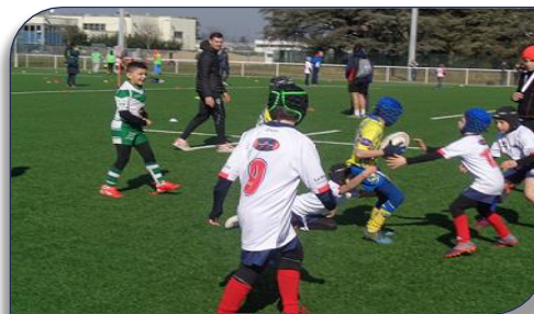
rencontre U9 entre Caluire RL et DRL