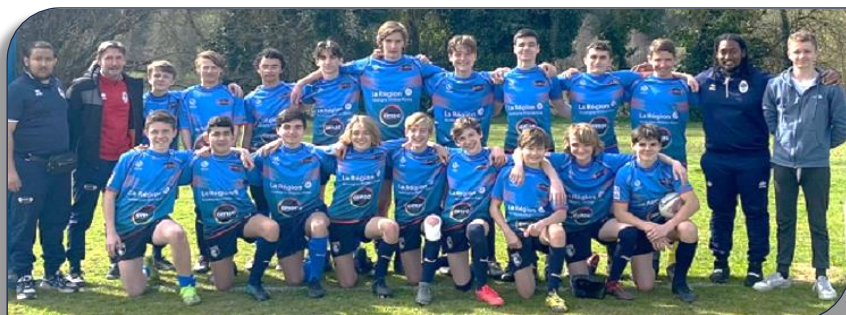
La formation du Comité Rhône et Métropole de Lyon de rugby à XIII

Deux jours 100% rugby à XIII ! Au stade Lucien Desprats, les U15 se sont affrontés lors du tournoi inter-comités. Le samedi était consacré aux phases de poule, tandis que le dimanche se déroulaient les phases finales. Les demi-finales ont été remportées par l'Aude face au comité Haute-Garonne et par le Pays Catalan face au Tarn. Le Comité Rhône et Métropole de Lyon rugby à XIII termine 8ème, dauphin de la Poule Développement derrière le Lot/Aveyron. Le matin pour la demi-finale la sélection du Vaucluse s'est imposée 12 à 0 face au Rhône.