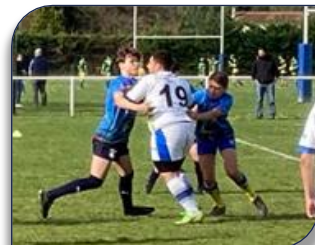
Attaque du Lot et Garonne face au Rhône