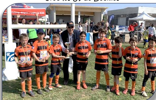
les U9 des Tigers de Villeurbanne