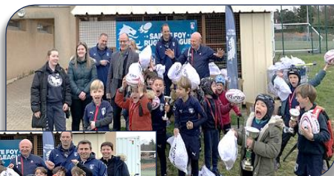
les jeunes U9 tout sourire