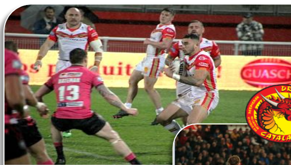
Attaque des Dracs face aux warriors de Wigan