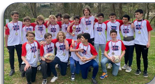
les Joueurs U15 du Comité RML avec le trophée et médailles