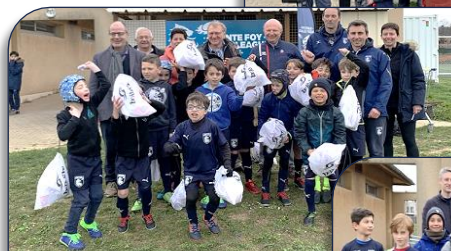
la joie des jeunes U11 de SFRL