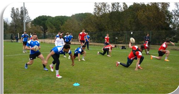
Ateliers physiques pour les joueurs du XIII de France