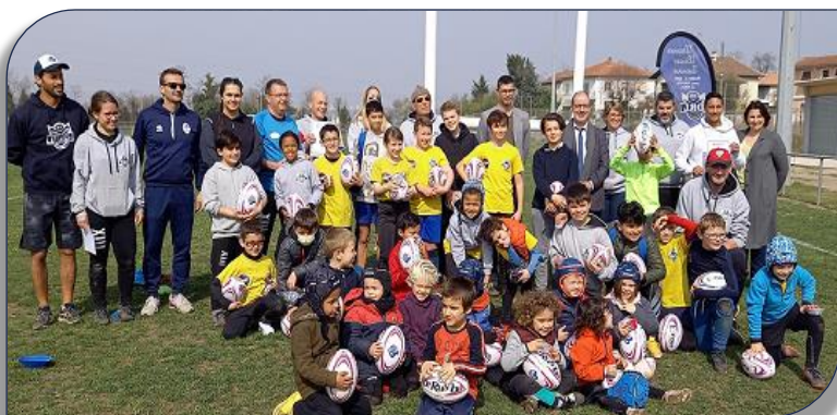
Photo souvenir des jeunes Décanois et éducateurs du club