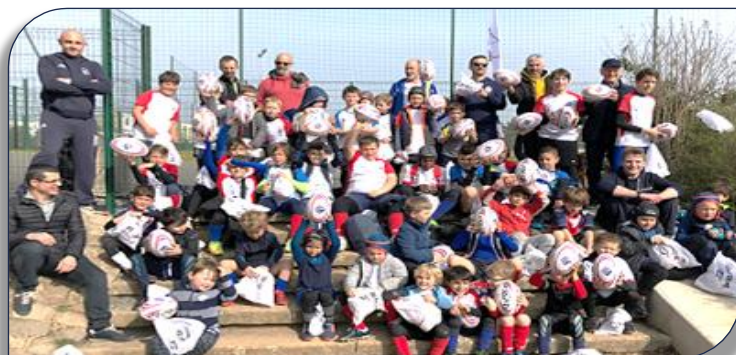
Le sourire des jeunes du Caluire RL avec le ballon et les dirigeants du Club