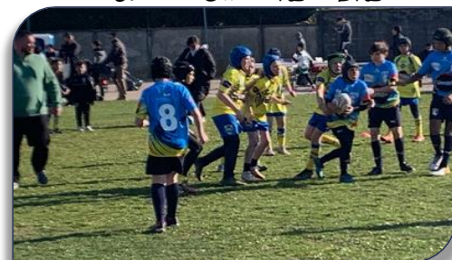
Rencontre U13 entre SFR et Décines RL