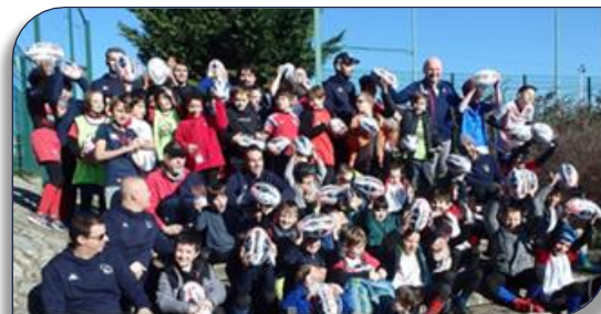
Remise des ballons aux jeunes de Caluire en Mars 2021

Le Comité Directeur de la FFR XIII a décidé de reconduire l'opération « un ballon pour tous » pour les catégories U5 -U7-U9-U11 et U13 des écoles de rugby à XIII. Comme la saison dernière, chaque enfant recevra en plus du ballon un protège dent pour encourager la pratique en toute sécurité. Au total il y aura 280 ballons pour ces jeunes des clubs de la Ligue AURA licenciés avant le 31 Janvier 2022. Les ballons de la FFR XIII seront reçus mi-Février à Lyon, et la cérémonie de remise des ballons aux licenciés sera organisée par chaque club.