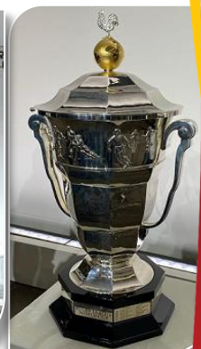
Le Trophée Paul Barrière

Cet événement sera une grande fête populaire qui s'appuiera sur la diversité des territoires de notre pays. Les délégations arriveront en octobre 2025 puis la compétition se déroulera pendant 5 semaines, jusqu'à la mi-novembre 2025. Près d'un million de billets sont mis en vente, à partir de la fin 2023, dans les stades et arenas (où se dérouleront les compétitions fauteuils). 100.000 supporters venus du monde entier sont attendus pour suivre France2025.