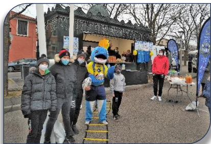
Le Dauphin avec les jeunes ...