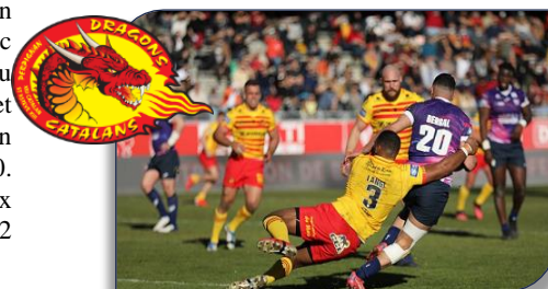
Le toulousain Bergal va être stoppé par Langi