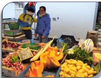
et avec les marchands du Marché

L'équipe dirigeante du DRL et leur mascotte étaient de sortie à l'aube pour préparer le kiosque du Marché du 23 janvier. Cela a favorisé des rencontres hivernales pour préparer le printemps du Rugby à XIII et du Sport en général, tout en vendant des soupes « fait Maison » avec des légumes cultivés à Décines : du local avant tout !