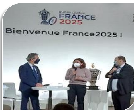
Intervention de Madame Roxana Maracineanu