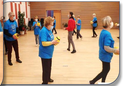
un atelier échauffement avec ballon