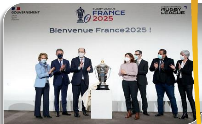
Les officiels souhaitent la Bienvenue à France 2025

France2025 rassemblera simultanément 4 compétitions : femmes, hommes, fauteuils et jeunes. Parce que l'inclusion est une valeur portée par le rugby à XIII, le format de la 17ème édition de sa Coupe du Monde sera donc totalement inédit. La compétition se déroulera dans 40 villes partout en France, notamment les villes moyennes qui font la richesse de nos territoires : France 2025 sera la Coupe du monde des territoires. De grandes métropoles, pour des raisons de capacité des installations, seront retenues pour l'organisation des demi-finales et des finales. Conçue comme un projet responsable écologiquement et économiquement , France2025 sera un accélérateur pour l'économie, le tourisme, l'emploi et la formation professionnelle, grâce aux retombées directes et indirectes engendrées par l'organisation de la compétition et aux plus de 2.000 formations professionnelles qui seront proposées par France2025 au cours des années 2023, 2024 et 2025. Ce sont ces enjeux et ces exigences, pour le pays comme pour ses territoires d'accueil de la Coupe du Monde, qui ont été portés lors d'une table-ronde d'ouverture par Madame Caroline Cayeux, Présidente de Villes de France, Monsieur Kamel Chibli, Vice-Président de Régions de France, Monsieur Luc Lacoste, Président de la Fédération Française de Rugby à XIII, Madame Claude Revel, Présidente du GIE France Sport Expertise et de Monsieur Thierry Teboul, Directeur Général de l'Opérateur de compétences Afdas.