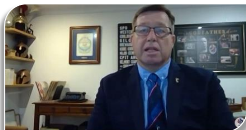
Intervention de M. Troy Grant Président de l'IRL

L'organisation de cette Coupe du Monde 2025 par la France traduit de manière particulièrement éclairante la nouvelle dimension prise par le Rugby à XIII en France depuis l'élection, en décembre 2020, de Luc Lacoste à la présidence de la Fédération Française. Cette attribution marque en effet la volonté des instances internationales (IRL au plan mondial, ERL au plan européen) de faire de la France une nouvelle place forte de la stratégie de développement du Rugby à XIII dans le monde.