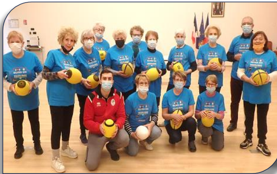
Le groupe de séniors Apicil de Givors