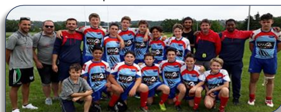
La délégation du Comité du Rhône lors des inter-comités 2019 à Albi

Après avoir été annulées à 2 reprises à cause de la pandémie, les rencontres Inter-Comités auront lieu les 19 et 20 mars prochain à Cahors. Un stage de préparation physique des minimes (U15) des clubs du Comité du Rhône aura lieu le 18 Février prochain de 14H à 17H au stade ENNA de Villeurbanne